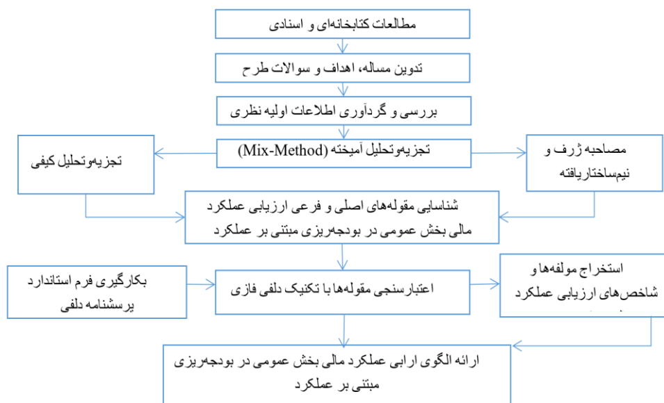
شکل ۱- فلوچارت مراحل طراحی الگو