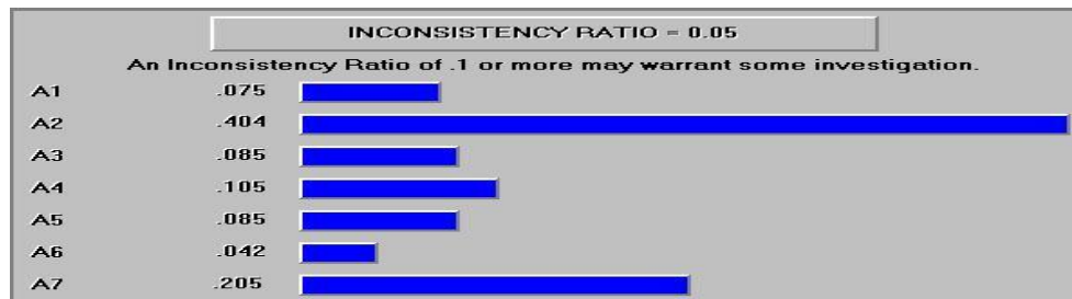
نمودار ۲: اولویت‌بندی موانع فردی کار تیمی

کار تیمی بوده است. در مجموع ضریب اهمیت این دو شاخص بیش از ۵۰ درصد بوده است که بیانگر اهمیت بالای آن‌ها می‌باشد. پس از این دو مانع، شاخص‌های «ناهماهنگی بین اعضای تعاونی‌ها و سازمان‌های ذی‌ربط»، «پایین بودن تعاملات مستقیم، شخصی و در رو»، «عدم ارائه اطلاعات مناسب به اعضای تعاونی‌ها»، «حمایت ناکافی مدیران از کار تیمی در تعاونی‌ها» و «پایین بودن استقلال کاری اعضای تعاونی‌ها»، به ترتیب مهم‌ترین موانع سازمانی کار تیمی در تعاونی‌های کشاورزی شهرستان همدان بوده‌اند.