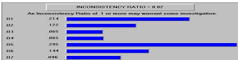
نمودار ۳: اولویت‌بندی موانع سازمانی کار تیمی

نبودن اعضای تعاونی‌ها با یکدیگر»، به ترتیب مهم‌ترین مهم‌ترین موانع کاری کار تیمی در تعاونی‌های کشاورزی شهرستان همدان بوده‌اند.