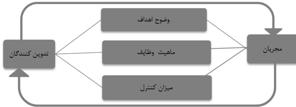
شکل ۲: ارتباط مجریان و خطمشی گذاران

توانائی سیستم برای بقا با ۷٪ در درجه بعدی قرار داشتند. نتایج تحقیق حاکی از آن است که تدوین کنندگان و مجریان قوه قضائیه ضمن اهمیت به سایر معیارهای مرثر بر ارزیابی پیامدهای خطمشی (دستیابی به هدف، عکس العمل خدمت گیرندگان (مراجعات) و حفظ و نگهداری سیستم بحث کارائی خطمشی گذاران را در اولویت قرار دهند. ارزیابی خطمشی، پی بردن به پیامدهای خطمشی است و یا به تعبیر دیگر ارزیابی خطمشی، ارزیابی اثربخشی کلی یک برنامه ملی در دست یابی به اهدافش و یا اثربخشی نسبی دو یا چند برنامه در دستیابی به اهداف مشترک است. در ارزیابی خطمشی علاوه بر خروجی های ملموس، به آثار کوتاه مدت و بلند مدتی که خطمشی در گروه های هدف و غیر هدف خود می گذارد و هزینه های مادی و معنوی آن توجه می شود (دای، ۲۰۰۵).