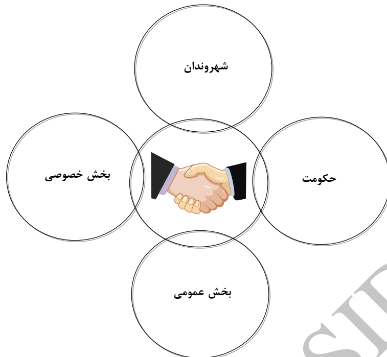
شکل شماره (۱): انواع ذی‌نفعان

- زبیری و همکاران (۱۳۸۷) در پژوهشی، به بررسی مشارکت شهروندان و نقش آن در مدیریت شهری شهرهای کوچک پرداخته‌اند. نمونه‌های موردی آن‌ها سه شهر "گله‌دار" در استان فارس، "ورزنه" در استان اصفهان و "هیدج" در استان زنجان بوده است. آن‌ها ابتدا پرسش‌نامه‌ای برای سنجش میزان مشارکت در شهرهای کوچک را تهیه کردند و در میان جامعه نمونه که ۲۵۵ نفر بالای شانزده سال بوده‌اند پخش کرده‌اند؛ این پرسش‌نامه‌ها را در محیط نرم‌افزار SPSS مورد تجزیه و تحلیل قرار داده‌اند و در نهایت به این نتیجه رسیده‌اند که مشارکت مردم در مدیریت شهری در سطح ضعیفی قرار دارد.