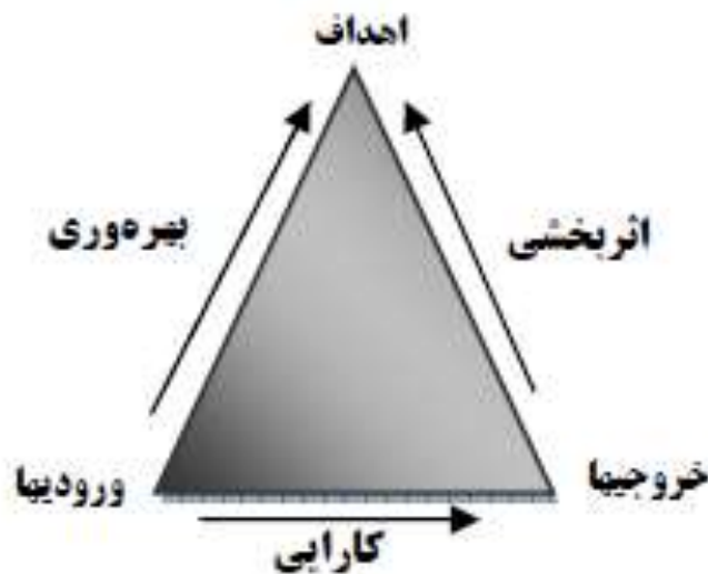
شکل ۱: ارتباط کارایی، اثربخشی و بهره‌وری

بهره‌وری مفهومی است که برای نشان دادن نسبت برون داد یک فرد، واحد و سازمان به کار گرفته می‌شود هر چه بهره‌وری یک سازمان بیشتر باشد هزینه تولید واحد کار در آن کمتر خواهد بود. در جهان پر رقابت امروز اگر بخواهیم بهره‌وری سازمان محل کار خود را افزایش دهیم باید با نیروی انسانی کمتر، سرمایه کمتر، زمان کمتر، فضای کمتر و به طور کلی با منابع کمتر، تولید بیشتری داشته باشیم. بهره‌وری یک سازمان بیش