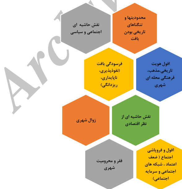
شکل ۱: مسائل اساسی محله امامزاده یحیی

به منظور تجزیه و تحلیل اطلاعات و داده‌ها در بخش کمی، از دو روش آمار توصیفی و آمار استنباطی استفاده شده است. از آمار توصیفی به منظور تعیین فراوانی‌های ویژگی‌های جمعیت شناختی و فراوانی‌های پاسخ‌های داده شده به هر یک از گویه‌ها استفاده شد. در بخش آمار توصیفی از جداول توزیع فراوانی و درصد، میانگین به عنوان شاخص گرایش مرکزی و از انحراف معیار و واریانس به عنوان شاخص‌های پراکندگی استفاده گردید. در سطح آمار استنباطی، به منظور تحلیل داده‌های حاصل از پرسشنامه تعیین وضعیت فرهنگی و اجتماعی محله امامزاده یحیی واقع در منطقه ۱۲ شهرداری تهران، (مبنی بر تعیین نقاط قوت و ضعف، فرصت‌ها و تهدیدها)،