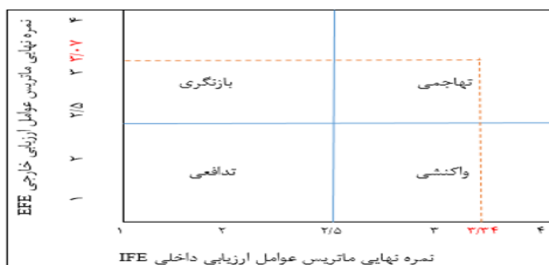
شکل ۳- نمودار نمره نهایی ماتریس عوامل ارزیابی داخلی و خارجی