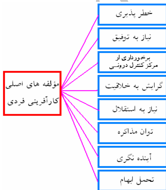
شکل (۲): مدل مفهومی پژوهش

که والدینش شغل آزاد دارند و برای خود کار می‌کنند، بیش از افرادی که شغل والدینشان دولتی است، علاقه دارند تا برای خود کسب و کاری ایجاد کنند. پس اگر چند تن از اطرافیان به نوعی کار آفرین باشند، احتمال خیلی زیادی دارد که فرد نیز به سوی فعالیت‌های کار آفرینانه سوق پیدا کند. (اینار ۲۰۰۵، ۲۰)