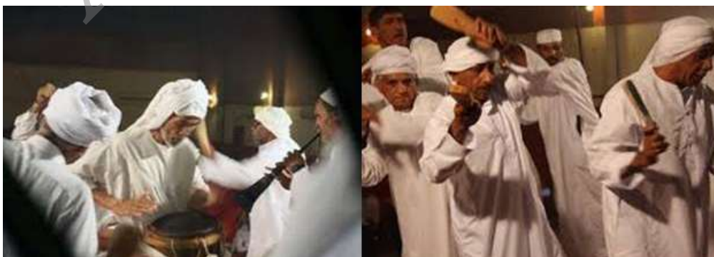
«مراسم لیوا» برگرفته از مراسم اجرا شده در حوزه‌ی هنری استان هرمزگان، ۱۳۹۰

در واقع از میان مجموعه‌ی بادها، «لیوا» از سبک‌ترین و کم‌خطرترین آن‌ها است (نصری اشرفی، ۳۷:۱۳۷۹) و به‌عنوان تفریحی عمومی مورد توجه قرار دارد. تقریباً همه‌ی معتقدان به این‌گونه آیین‌ها علاقه‌مندند تا به‌صورت داوطلبانه، در مراسم آن شرکت کرده و به رقص و بازی بپردازند. «لیوا» در بلوچستان بر دو قسم می‌باشد: