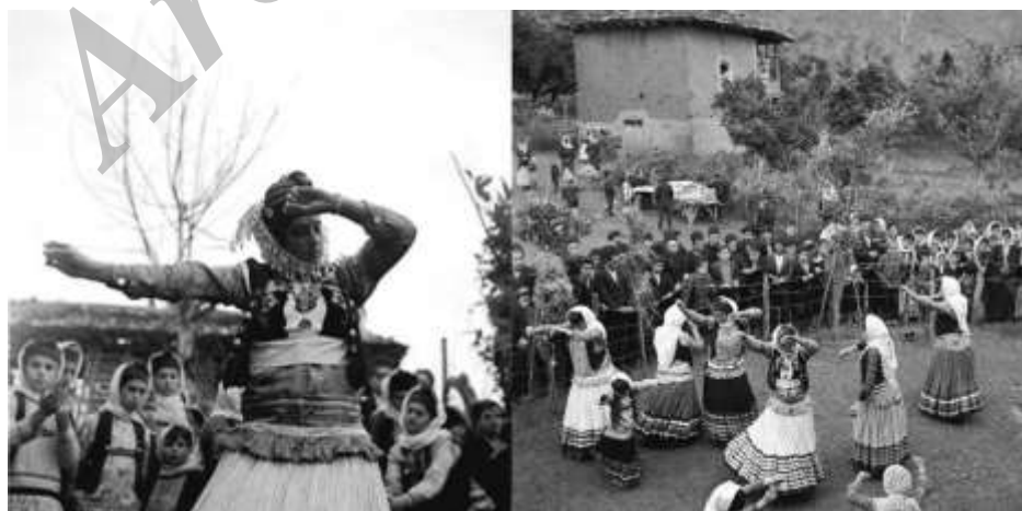
«رقص قاسم‌آبادی» گیلان

رقص رایج زنان این منطقه «قاسم‌آبادی» است. رقصنده دو لیوان یا استکان را با هر دست خود برداشته که در اصطلاح به آن «دس سنج» گفته می‌شود.