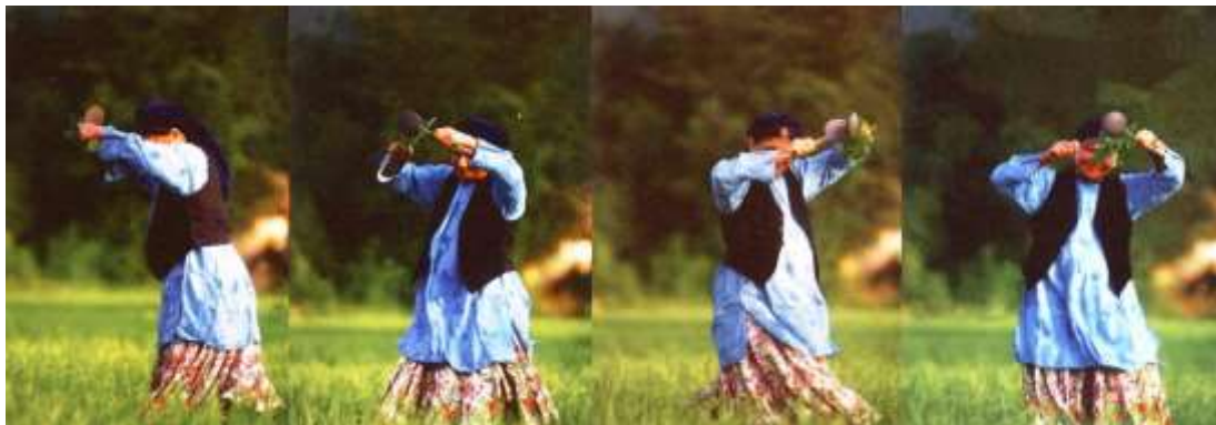
«کترا رقص» گیلان، تالش