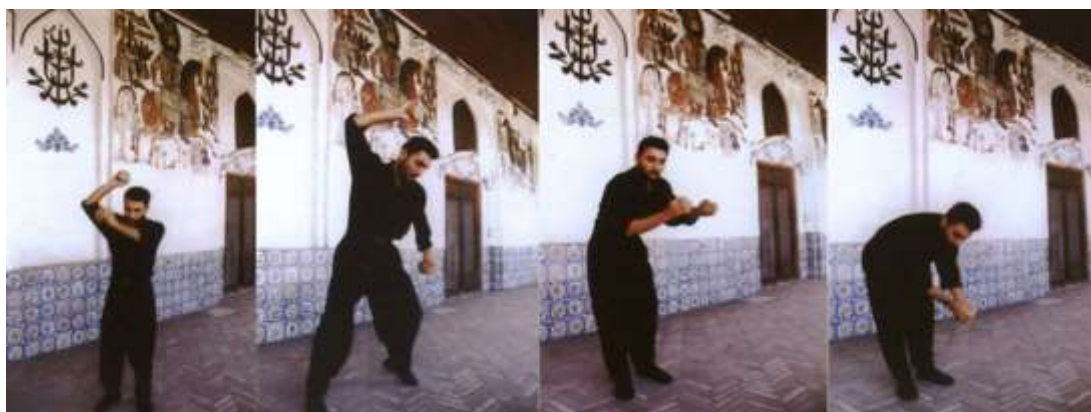
شکل ۲: «کرب زنی» گیلان، لاهیجان