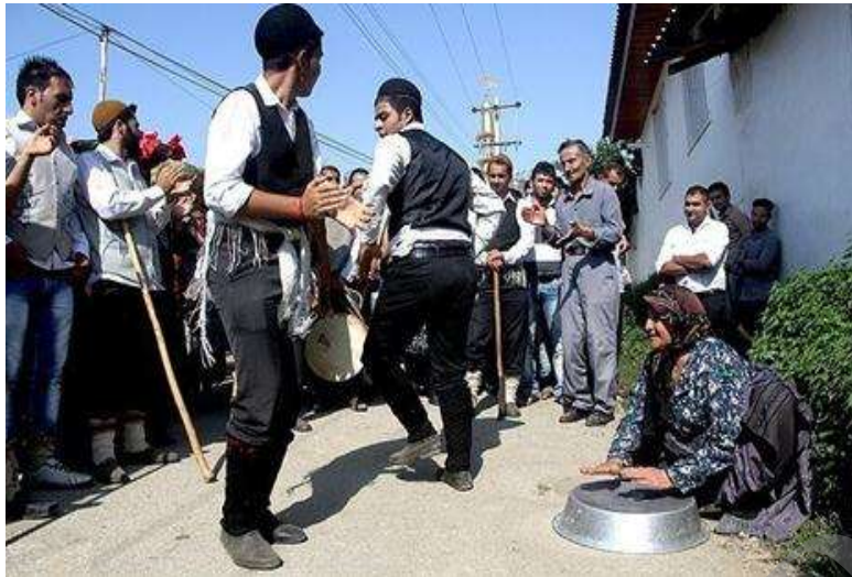
«رقص لاک سری سیم» مازندران