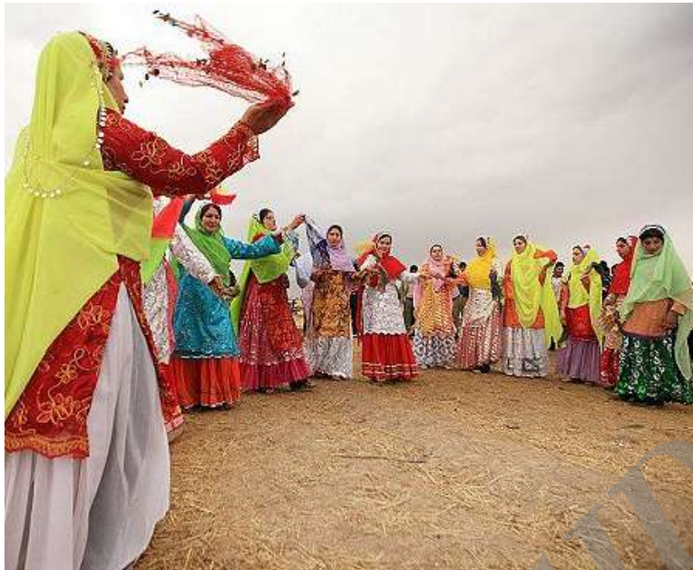
«رقص زنان قشقایی»