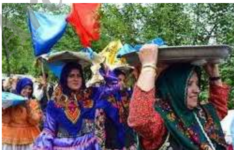
«رقص با مجمه» گیلان

این رقص با نواختن تشت همراهی می‌شده و گاه با آهنگ‌های لاره لاره، داجینیم یار یار و... نیز در فصل بهار و روزهای نوروز خوانده می‌شده است. (درویشی، ۱۳۸۰: ۱۹۰) در غرب مازندران (تنکابن، رامسر و...) به این مراسم «پشت لاک کوتون» (پشت تشت کوبون) می‌گویند. (درویشی، ۱۳۸۴: ۵۵۱)