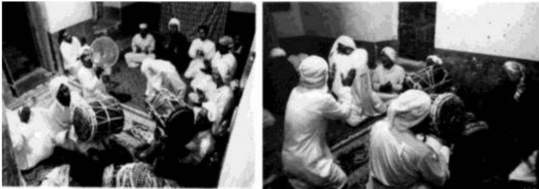
«مراسم زار» روستای سلخ در جزیره‌ی قشم، ۱۳۸۳