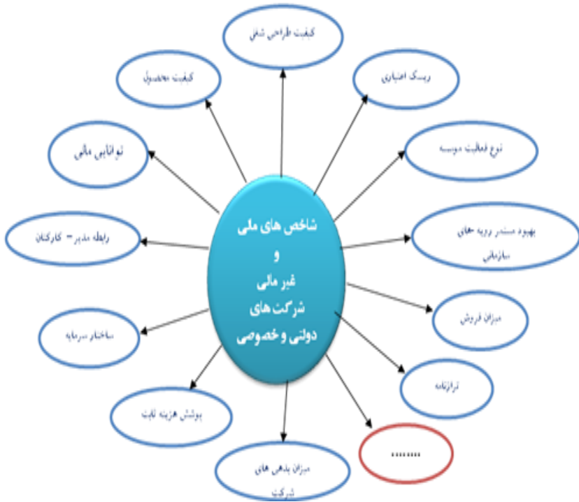
شکل (۱): مدل مفهومی تحقیق

از نوع کمی و یا از نوع کیفی می‌باشند. همچنین جهت بعضی از شاخص‌ها مثبت و بعضی دیگر منفی می‌باشد. مدل مفهومی تحقیق در شکل شماره ۱ آمده است: