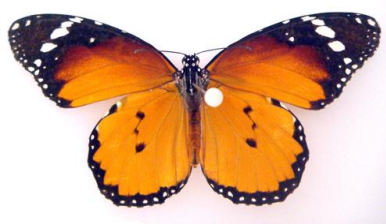
شکل ۹- شفیره (سبزرنگ)