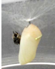
شکل ۵- لارو سن چهارم