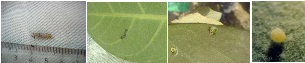
شکل ۱- تخم