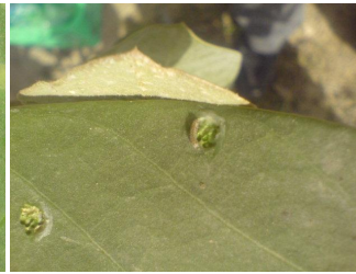
شکل ۲- لارو سن اول