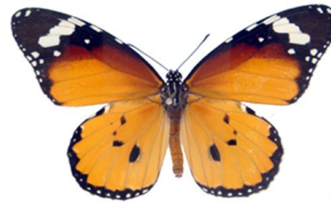
شکل ۱۰- حشره کامل (نر)