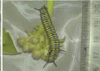
شکل ۷- پیش شفیره