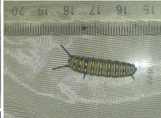
شکل ۶- لارو سن پنجم