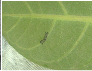
شکل ۳- لارو سن دوم