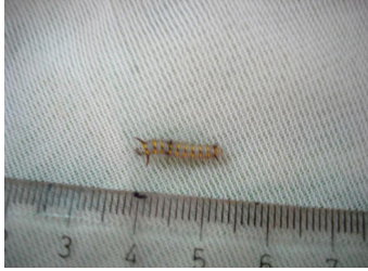
شکل ۴- لارو سن سوم