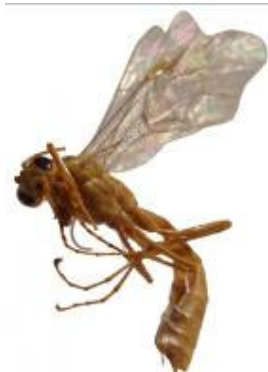
شکل ۳- حشره کامل گونه Ophion obscurus از زیرخانواده Ophioninae