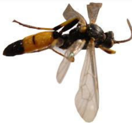
شکل ۴- حشره کامل Ichneumon caloscelis