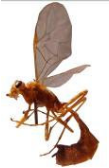
شکل ۲- حشره کامل گونه Ophion luteus از زیرخانواده Ophioninae