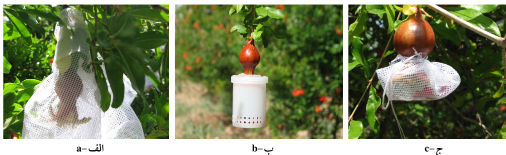
شکل ۱- انواع پوشش‌های میوه انار: الف- پوشش کامل میوه انار با توری پارچه‌ای، ب- پوشش تاج میوه انار با قوطی پلاستیکی، ج- پوشش تاج میوه انار با توری پارچه‌ای