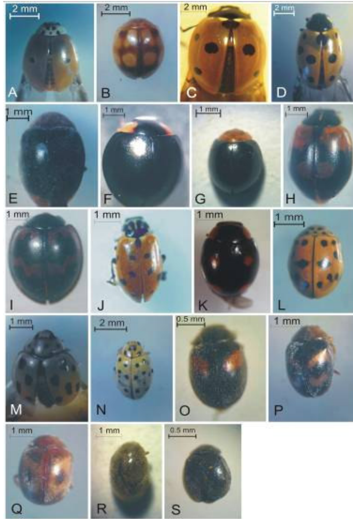
شکل ۱- نمای پشتی کفشدوزک‌های بالغ