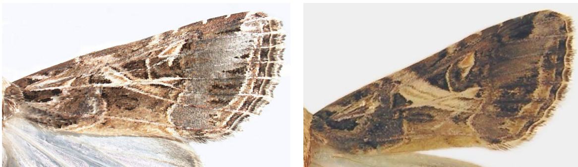
شکل ۱- بال جلویی S. litura (سمت راست)، بال جلویی S. littoralis (سمت چپ)

در مجموع ۴۹۲۸ شب‌پره S. exigua توسط تله‌های حاوی فرومون جنسی S. exigua و ۱۹۶۹ شب‌پره S. littoralis توسط تله‌های حاوی فرومون جنسی S. littoralis و ۱۹۹۲ شب‌پره S. littoralis توسط تله‌های فرومون جنسی S. litura شکار شد. در طول فصل زراعی چغندرقد شب‌پره S. litura شکار نشد. بیش‌ترین میزان شکار توسط تله طعمه‌گذاری شده با فرومون جنسی S. exigua با میانگین روزانه ۶/۵۸ شب‌پره نر و کم‌ترین میزان شکار توسط تله طعمه‌گذاری شده با فرومون جنسی S. littoralis با میانگین روزانه ۲/۷۴ شب‌پره نر به ثبت رسید.