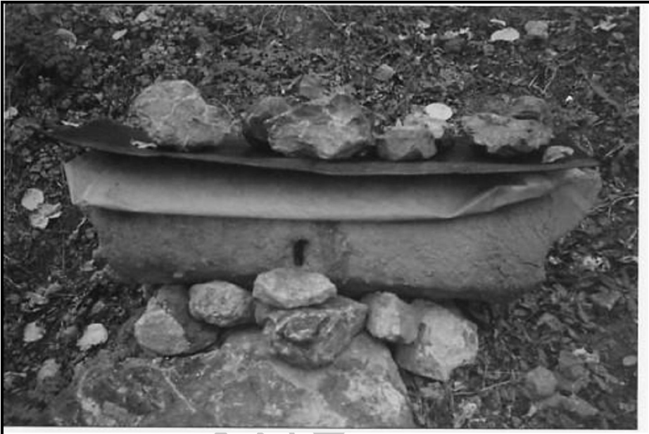
شکل ۱. کندوی زنبورعسل با مخزن کلی (تکنیک ایران باستان) در روستای یازن در ارتفاع ۲۳۵۰ متری واقع در اطراف قله سماموس رودسر

قلعه رودخان، ماسوله قدیم و ماسوله جدید، امامزاده ابراهیم(ع)، امامزاده اسحاق(ع)، اسپیلی؛ دیلمان، سفیدآب رحیم آباد وجواهردشت و ... را نام برد (شکل ۱).