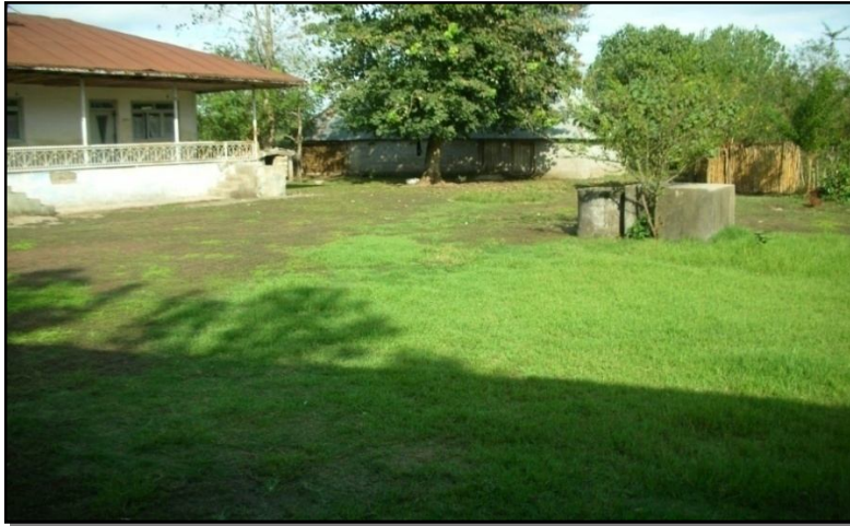
شکل ۵. نمایی از عدم استفاده مطلوب از فضاهای خالی داخل بافت دایر روستا