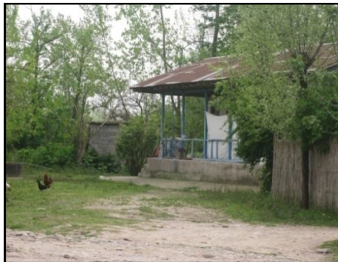
شکل ۴. نمایی از تخریب اراضی کشاورزی و تبدیل آن به واحدهای مسکونی