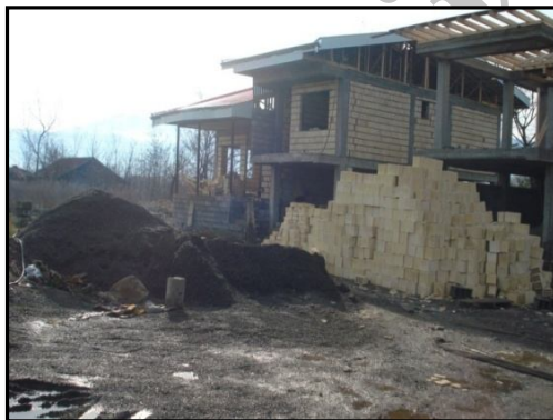
شکل ۳. اختصاص مساحت زیاد به کاربری مسکونی در روستاهای جلگه‌ای