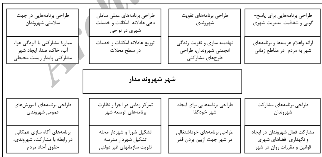
شکل ۱. ملزومات شهر شهروندمدار

انسانی باقی نگذاشته و شهرها تبدیل به فضایی برای کار و خواب، بدون انسجام اجتماعی گردیده‌اند. همه نوع وسایل زندگی در عرصه‌های شهری آماده شده و این درست همپای دور شدن انسان‌ها از یکدیگر است. هر برنامه‌ی عمرانی و هر اقدامی که به گسترش کالبدی یا رفاه شهری می‌انجامد، باید به نحوی عمیق مورد توجه قرار گیرد، تا در این رهگذر جایگاه انسان و ارزش‌های انسانی را ارج نهاده و مرتبت دهد. منظور آن است که مدیریت شهری تشخیص دهد که چیزهایی برای سلامت زندگی در شهرها لازم و چه چیزهایی مضر است. مدیریت شهری، با حفظ اصول باید برای این مسایل به چاره اندیشی بپردازد (نجاتی حسینی، ۱۳۸۰: ۳۸). مهمترین وظیفه مدیریت شهری که با هدف تقویت و بهبود اجتماع محلی کارآمد و مؤثر باید انجام گیرد، شهروند سازی (To build citizenship) است. شهروند سازی یعنی فراهم نمودن امکانات، تسهیلات و ساز و کارهای لازم برای شهروندان تا آنها از حقوق شهروندی شان بهره مند شوند و ضمناً بتوانند به نحوی مناسب وظایف و تکالیف شهروندی شان را در قبال جامعه محلی و شهری که در آن زندگی می‌کنند انجام دهند. تحقق عدالت اجتماعی در سطح محلی و شهری از وظایف مدیریت شهری است (Demaine, OP.Cit: 163-178). روبرط مناسب شهروندی و مدیریت شهری باعث بسط توانایی‌های شهروندان، تقویت حس تعلق اجتماعی شهروندان به شهر، تقویت حس اعتماد اجتماعی شهروندان به نظام مدیریت شهری و نیز حل مشکلات شهری از طریق مشارکت شهروندان و مدیریت شهری می‌شود (نجاتی حسینی، ۱۳۸۰: ۴۱).