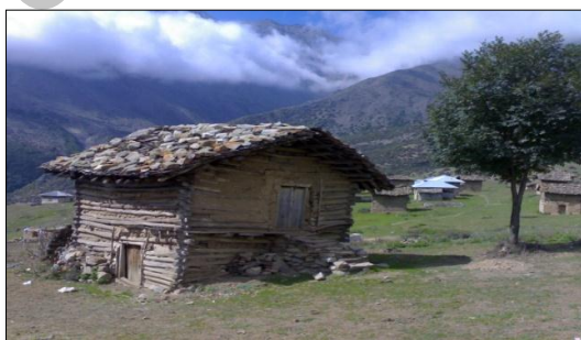
شکل ۳. مسکن دارورچین، روستای بالابند

مسکن دارورچین: این نوع مسکن در سازگاری کامل با اقلیم و نوع فعالیت اقتصادی حاکم بر محدوده مورد مطالعه است که در نواحی کوهپایه‌ای و کوهستانی و محدوده‌هایی که به جنگل نزدیک است، ساخته می‌شوند. کلمه دارورچین از سه لغت دار، به معنی درخت و ور به معنی پهلوی و چین به معنی چیدن تشکیل شده است. ساخت دارورچین اغلب به صورت یک اتاقی با بام لته‌سر اجرا می‌شود. مساکن با دیوار دارورچین و بام لته‌سر محل سکونت کوه‌نشینان است. با توجه به جدول (۱)، روستاهای تالش سرا، نمکدره، نوشا، پیازکش و خانیان بیشترین درصد را در این نوع مساکن دارا می‌باشند و کمترین درصد در روستاهای جواهرده، کنسکوه، جنت رودبار، امامزاده قاسم، لتر و تودارک مشاهده می‌شود که نشان‌دهنده تحولات ناچیز در این روستاهاست. دلیل عمده آن ناشی از دور بودن از مسیر ارتباطی اصلی می‌باشد. در روستاهای نمونه ۲۹ درصد مساکن از نوع دارورچین می‌باشد. نمونه و نحوه ساخت این نوع مساکن را می‌توان در ترکیه به خصوص در منطقه بولو و حوالی آن که ساخت این نوع مساکن به جهت وجود جنگل‌های فراوان، متداول است، مشاهده نمود.