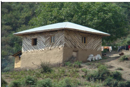
شکل ۴. مسکن زیگامه، روستای کوهسر

شکل کامل‌شده‌ای از مسکن دارورچین می‌باشد که پس از یکجانشین شدن به صورت دائم آن را تغییر داده‌اند. با توجه به جدول، روستاهای کوهسر، کنسکوه، لتر و پیازکش بیشترین تعداد را در این نوع مسکن دارا می‌باشند. مسکن زیگامه در روستاهای مورد مطالعه حدود ۳۵ درصد مسکن را شامل می‌شوند.