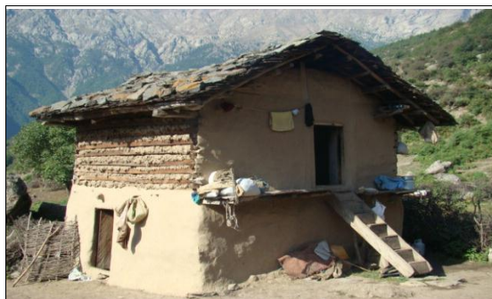
شکل ۲. کارکردهای مساکن سنتی - روستای بالابند