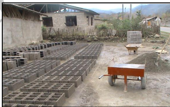
شکل ۵. مسکن جدید (بلوکه)، روستای لیره سر

مسکن جدید (بلوکه): این مسکن به تقلید و الگوبرداری از مسکن غیر بومیان در محدوده مورد مطالعه ساخته شده که از مصالح جدید و با فونداسیون پرهزینه و مقاوم می‌باشد. در واقع یکی از جنبه‌های تأثیرگذاری افراد غیر بومی، تحول در نوع و شکل ساخت مسکن است. از آنجایی که تعداد گردشگران بسیار زیاد می‌باشد و همه دارای مسکن شخصی نیستند، جهت اقامت خود مسکن روستایی را اجاره می‌کنند و این عامل انگیزه‌ای برای روستاییان جهت ساخت مسکن به سبک جدید با مصالح جدید، شکل‌تر و با وسایل رفاهی بیشتر و اجاره آن به گردشگران ایجاد نموده است. به علت تغییر کارکردها، شکل فرم مسکن نیز تغییر یافته است. به طوری که مسکن به صورت یک طبقه و یا اگر دو طبقه بنا شده باشد، طبقه همکف آن به جای اختصاص به دام به عنوان یک اتاق و فضای اضافی برای استراحت خانواده به خصوص در فصول گرم که ممکن است طبقه دوم را اجاره دهند و یا جهت انبار کردن محصولات و ابزار کشاورزی و وسایل اضافی منزل، به عنوان انباری استفاده شود. با توجه به جدول (۱)، تعداد این مسکن در روستاهای نمونه ۳۳ درصد از مسکن را به خود اختصاص داده‌است.