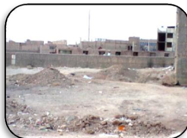
شکل ۲. وضعیت کیفیت مسکن محله از نگاه تصاویر