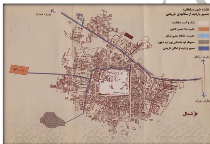
شکل ۲. شهر سلطانیه و محل گنبد سلطانیه