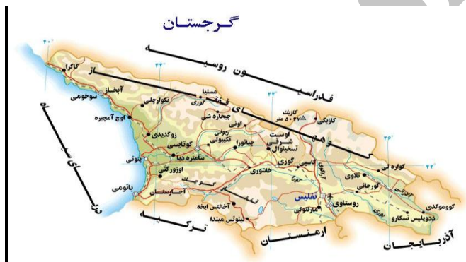
شکل ۲. موقعیت جغرافیایی کشور گرجستان

نزدیکی دولت وقت، به ویژه شخص شوارد نادره به روسیه، این کشور تن به مصالحه با روسیه داد و پذیرفت که در امور جمهوری‌های خود مختار اوستیای جنوبی و آبخازیا دخالت نکند و با حضور نیروهای روسی در این دو منطقه مخالفتی نداشته باشد. اما پس از انقلاب رز (رنگین/مخملی) در سال ۱۳۸۲ در گرجستان که با پشتیبانی آمریکا صورت گرفت و منجر به برکناری دولت متمایل به روسیه و روی کار آمدن دولت غرب‌گرای میخائیل ساکاشویلی شد، اوضاع سیاسی این کشور دگرگون شد. دولت جدید سیاست دوری از روسیه و نزدیکی به غرب (به ویژه آمریکا) را در پیش گرفت. همچنین این کشور خواهان عضویت در اتحادیه اروپا و ناتو شد. در مرداد ۱۳۸۷ و همزمان با بازی‌های المپیک تابستانی ۲۰۰۸ پکن، ارتش گرجستان برای بازگرداندن اوستیای جنوبی به خاک خود، به این منطقه یورش برد که با واکنش شدید روسیه مواجه شد و مجبور به عقب نشینی شد. اکنون روسیه تنها کشوری است که استقلال دو منطقه آبخازیا و اوستیای جنوبی را به رسمیت شناخته است و با حضور نیروهای خود در این دو منطقه، عملاً کنترل آنها را در دست دارد ( http://www.iraneurasia.ir/fa/pages/clist.php?pa=72,1 ).