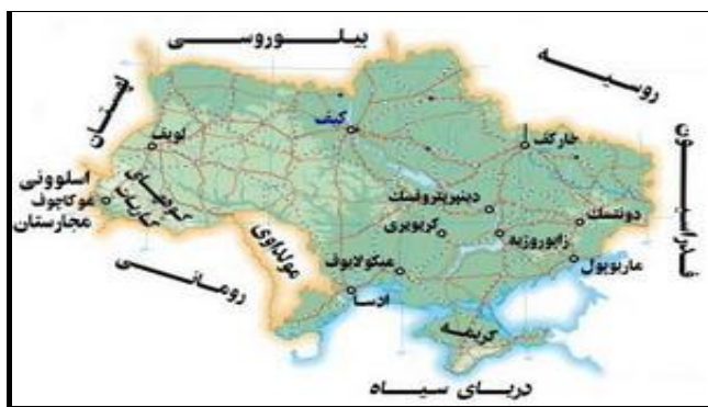
شکل ۳. موقعیت جغرافیایی کشور ایران