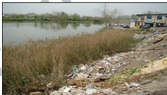
شکل ۳. عدم شیوه دفع مناسب زباله در محله عینک رشت

در خصوص میزان برخورداری از خدمات زیربنایی به شیوه برداشت پلاک به پلاک آمارها به شرح زیر می‌باشد. میزان برخورداری از آب لوله کشی شهری ۴۵/۷۲ درصد، برق ۸۵/۶۴ درصد، گاز ۸۰/۹۳ درصد و تلفن ۸۲/۳۵ درصد می‌باشد. در محله استخر عینک ۵۵/۷ درصد از جامعه آماری وضعیت فاضلاب را نامناسب می‌دانند. ۵۰/۵ درصد از خانوارها در مواقع بارندگی دچار آبگرفتگی در کوچه و خیابان می‌شوند. ۹۲/۲ درصد از خانوارهای محله استخر عینک در بررسی پیمایشی اظهار داشتند که جمع آوری زباله‌ها توسط شهرداری صورت می‌گیرد اما این کار چند روز یکبار انجام می‌گیرد.