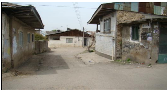
شکل ۴. شبکه معابر با سیستم روشنایی نامناسب در محله عینک رشت