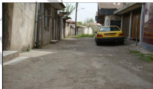
شکل ۲. نمایی از شبکه معابر در محله عینک رشت