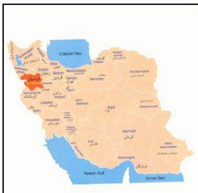
شکل ۱. جایگاه استان کردستان در تقسیمات کشوری