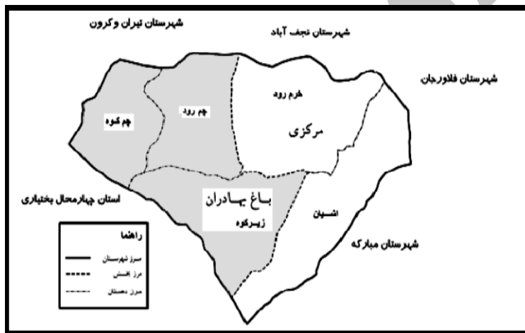
شکل ۱. موقعیت جغرافیایی محدوده مورد مطالعه

بخش باغبانان از فاصله ۶۰ کیلومتری جنوب غربی شهرستان اصفهان مابین ۵۰ درجه و ۵۶ دقیقه و ۱۸ دقیقه طول شرق و ۳۲ درجه و ۴۱ دقیقه عرض شمالی قرار گرفته است. این بخش در نیمه غربی شهرستان لنجان در غرب بخش مرکزی قرار گرفته و از شمال به شهرستان تیران و کرون و از شرق به بخش مرکزی و از غرب با استان چهارمحال بختیاری هم‌مرز است رودخانه زاینده رود در نواحی مرکزی آن قرار داشته و از غرب به شرق جریان دارد (فتحی باغبانان، ۱۳۷۲).