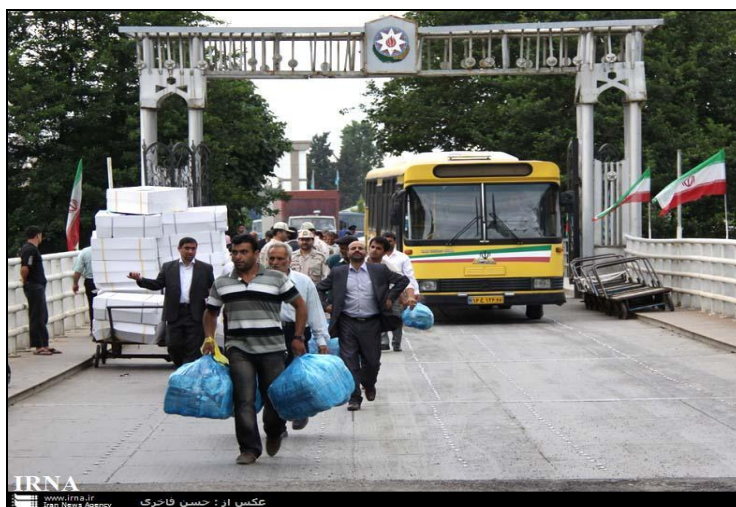
شکل ۲. نمایی از مشارکت روستاییان در تجارت چمدانی در گمرک آستارا