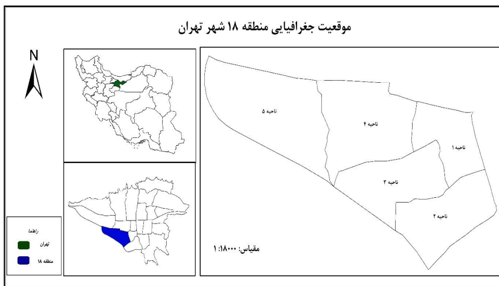
شکل ۱. موقعیت جغرافیایی منطقه ۱۸