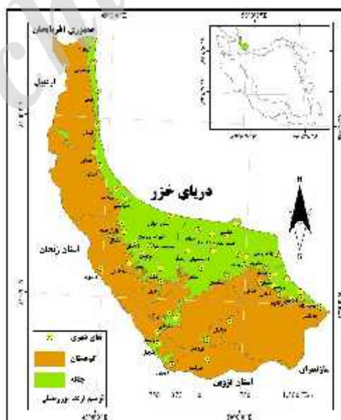
شکل ۱. پراکندگی نقاط شهری استان گیلان

محدوده مورد مطالعه این پژوهش استان گیلان می‌باشد. استان گیلان با مساحت ۱۴۰۴۴ کیلومتر مربع مساحت در ۳۶ درجه و ۳۳ دقیقه تا ۳۸ درجه و ۲۷ دقیقه عرض شمالی و ۴۸ درجه و ۳۲ دقیقه تا ۵۰ درجه و ۳۶ دقیقه طول شرقی از نصف‌النهار قرار گرفته است. استان گیلان بر اساس آخرین تقسیمات اداری - سیاسی دارای ۱۶ شهرستان، ۴۳ بخش، ۵۲ شهر، ۱۰۴ دهستان و ۲۵۸۳ آبادی دارای سکنه ۳۳۲ آبادی خالی سکنه می‌باشد (Management and planning organization of guilan, 2016).