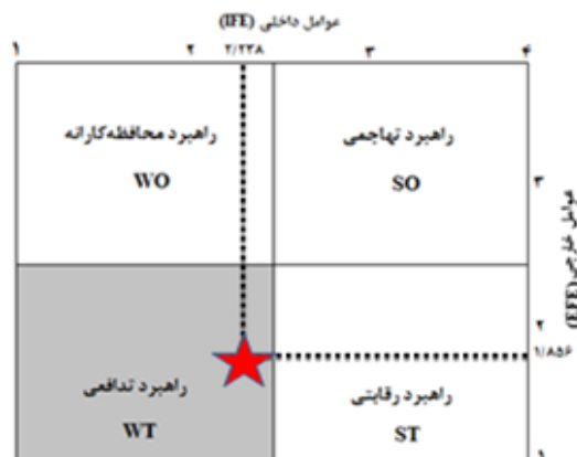
شکل ۳. تعیین راهبرد گردشگری ساحلی