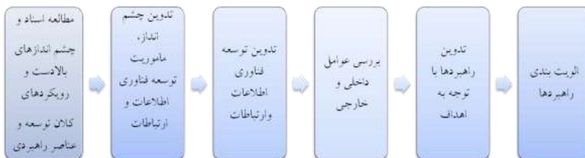
شکل ۱- مراحل پژوهش

فناوری اطلاعات در انجام وظایف و فرآیندهای سازمان می‌باشد. بیانیه مأموریت ICT به شرح زیر می‌باشد: