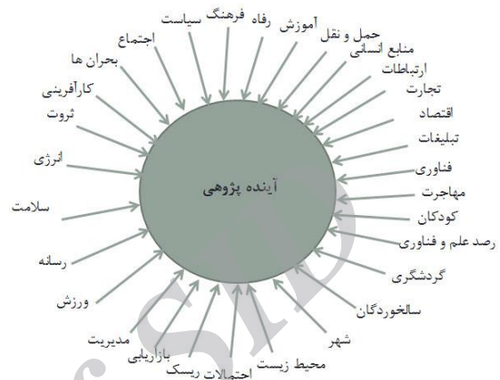
شکل ۱- انواع خدمات آینده پژوهی در آموزش عالی

علوم ضمن انگیزش علاقه اجتماع به موضوعی پراهمیت و بهره‌گیری از ابزار تکوین شده مناسب برای آن موضوع، تقریباً کاملاً آکادمیک بوده ولی از نظر کاربردی دنبال کردن این علوم به خصوص توسط کسب و کارها و بنگاه‌های دولتی، انجام می‌شود.