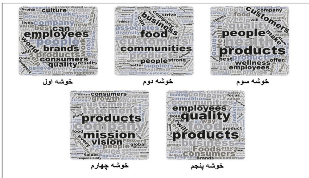
شکل ۳- نمایش گرافیکی توده کلمات در خوشه های خارجی

توده از کلمات ارایه نمودیم که بیشتر کلمات پرتکرار در متون کلیه اسناد داخل آن خوشه را به تصویر می‌کشد. در شکل ۳ نمایش گرافیکی توده کلمات برای خوشه های شرکت های صنایع غذایی خارجی را مشاهده می‌نمایید. مشاهده می‌گردد که پرتکرار ترین کلمات در این خوشه ها کلماتی نظیر مشتری، محصول، کارمندان و