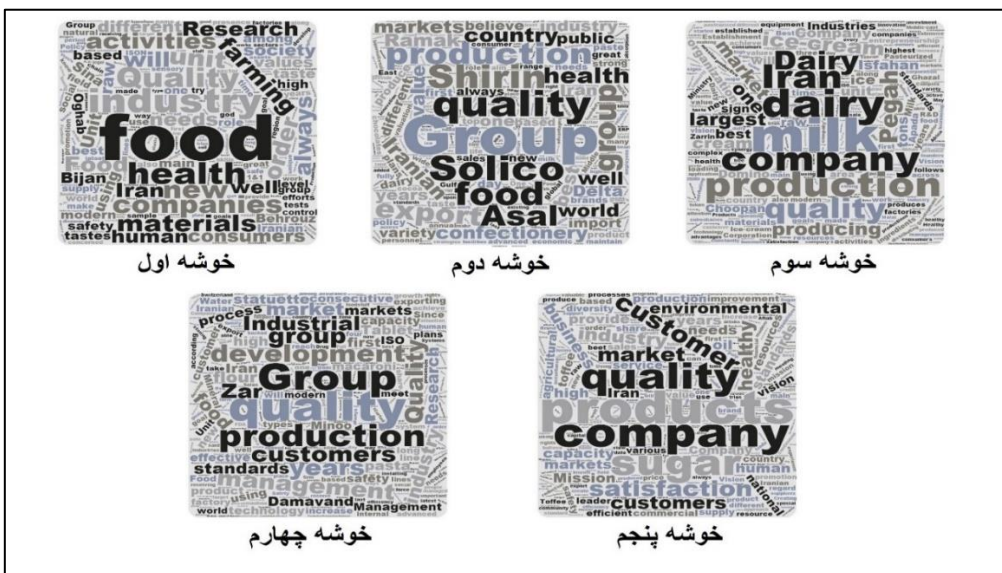
شکل ۴- نمایش گرافیکی توده کلمات در خوشه های ایرانی