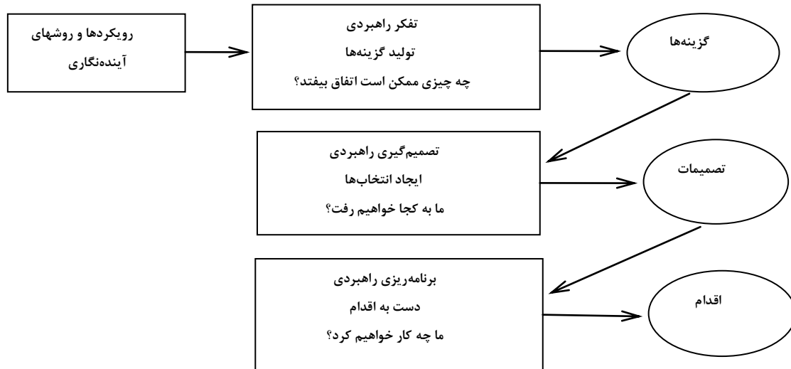
شکل شماره ۲- سه سطح چارچوب آینده‌نگاری راهبردی

تغییرات جاری ناکافی می‌باشند (Turturean, 2011). آینده‌نگاری ابزار مفیدی برای کمک به نگاهی فراتر از مسائل کوتاه مدت و ایجاد سیاست‌هایی برای زمان بلندمدت است. ترکیب آینده‌نگاری در فرایند سیاستی ساده نیست. اما برخی از معیارهای موفقیت را می‌توان شناسایی کرد که می‌توانند زنده ماندن و انعطاف‌پذیری برنامه‌های آینده‌نگاری در دراز مدت را تضمین کنند. از آنجمله می‌توان به مواردی همچون، غلبه بر سلطه کوتاه-مدت گرایی، گرد هم آوردن جوامع معرفتی مختلف و لینک کردن آینده‌نگاری با سیاست گذاری اشاره کرد (Dreyer & Stang, 2013).