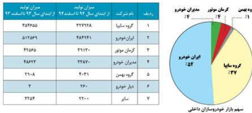
شکل ۲: سهم بازار خودرو سازان داخلی

حداقل ۲۰۰ نمونه توصیه شده است. متغیرهای پنهان همان عامل‌ها یا ابعاد مدل هستند و متغیرهای مشاهده پذیر نیز همان سوالات پرسشنامه می‌باشند. محاسبه حجم نمونه با فرمول کوکران و یا رجوع به جدول مورگان در اینجا مصداق ندارد. این یک خطای رایج در میان پژوهشگران است (حبیبی و عدن‌ور، ۱۳۹۶). در این تحقیق واحدهای استراتژی، بازاریابی و فروش این دو شرکت مورد بررسی قرار گرفته اند. بدین منظور لیستی از تعداد کارشناسان، مدیران و معاونان از این دو شرکت تهیه گردید. سپس تعداد ۵۴۰ پرسشنامه (پرسشنامه اول) برای ایشان ارسال گردید. با پیگیری های مکرر تعداد ۱۶۸ پرسشنامه از گروه سایپا و ۱۶۹ پرسشنامه از گروه صنعتی ایرانخودرو برگشت داده شد. در مجموع ۳۳۷ پرسشنامه جمع آوری شد که ۹ عدد از این پرسشنامه ها ناقص پر شده بود و تجزیه و تحلیل اطلاعات با ۳۲۸ پرسشنامه انجام شد. با توجه به نرخ پائین برگشت پرسشنامه در کشور، این رقم قابل قبول می باشد. با این وجود در این رساله تلاش شده است تا شرط حداقل ده برابر تعداد پرسشنامه ها برای هر متغیر مورد بررسی رعایت شود (هومن، ۱۳۸۵). اگر چه گیلفورد معتقد است در تحلیل عاملی حداقل حجم نمونه ۲۰۰ نفر می باشد (گیلفورد، ۱۹۵۶) ولی محققین دیگری این رقم را اغراق آمیز می دانند به عنوان مثال پل کلاین معتقد است در داده