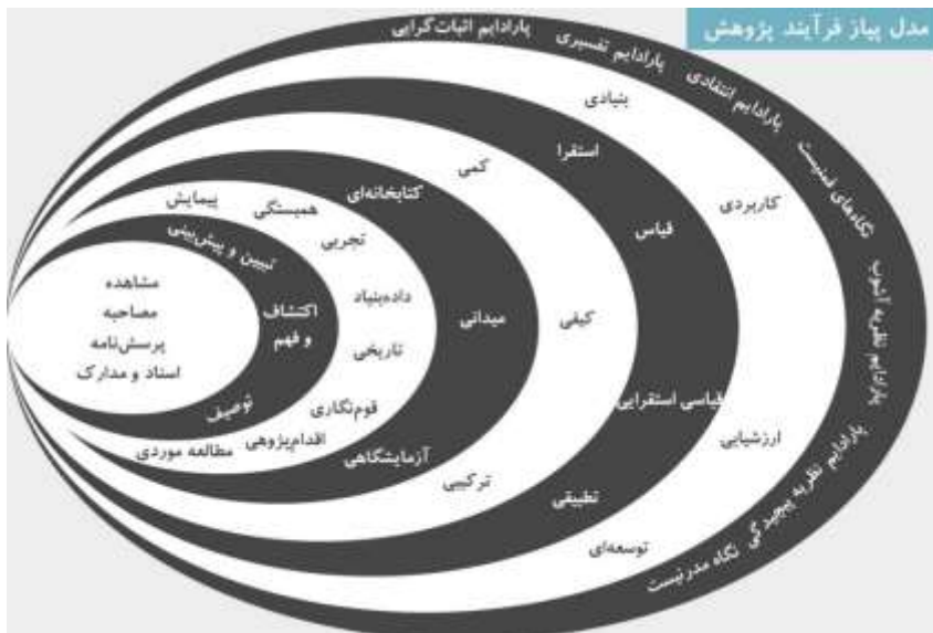
شکل ۱. لایه های پژوهش ساندرز

حکمرانی خوب در شهرداری شهر تهران، چه پیامدها و دستاوردهایی را به دنبال دارد؟ روش شناسی پژوهش به منظور دستیابی به هدف تحقیق حاضر، از روش پژوهش کیفی استفاده خواهد شد. در پژوهش کیفی برای درک و تبیین پدیده های اجتماعی از داده های حاصله از مصاحبه ها، مستندات، مشاهدات مشارکتی، مطالعات کتابخانه ای و ... استفاده می شود. این نوع پژوهش بر معنایی که افراد شرکت کننده در فرآیند اجرای تحقیق از پدیده مورد مطالعه در ذهن دارند، تاکید می ورزد. مبانی معرفت شناسی پژوهش حاضر نیز به مکتب تفسیرگرایی نزدیک تر است.