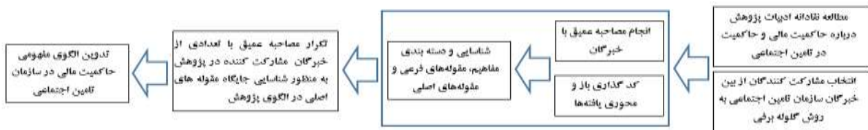
شکل ۱- مراحل اجرای پژوهش

سازمان تامین اجتماعی مطرح گردید. یافته های حاصل از مصاحبه های عمیق با خبرگان کد گذاری و تحلیل گردید. کد گذاری باز فرآیندی تحلیلی است که از طریق آن مفاهیم، ویژگی ها و ابعاد آنها از دل داده ها شناسایی و کشف می شوند (استراوس و کوربین ۱۹۹۶، ۶۲). از ۱۲۴ مفهوم اولیه حاصل از کد گذاری باز مفاهیم در متن مصاحبه های انجام شده، در مرحله بعد ۳۰ مقوله خرد شناسایی گردید. در ادامه ۱۴ مقوله کلان که تشکیل دهنده ۶ بعد اصلی پژوهش هستند، شناسایی گردید. به این منظور با استفاده از روش تحلیل سطر به سطر، مفاهیم شناسایی شده و سپس بر اساس ویژگی های مشترک، مشابهت و ارتباطات مفهومی به مقوله های خرد دسته بندی گردید. در ادامه بر اساس دانش زمینه ای کسب شده از مطالعه ادبیات موضوع، مقوله های خرد نیز بر اساس ارتباط مفهومی در سطح بالاتری از انتزاع به مقوله های کلی دسته بندی شدند که در ادامه بیان می گردد. گام های فرآیند اجرای پژوهش در شکل شماره ۱ ارایه شده است.