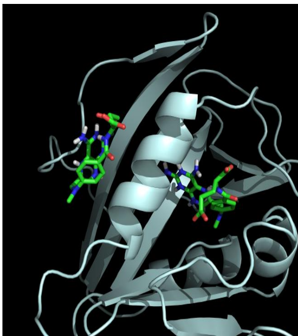
شکل ۳- نمای سه بعدی از مقایسه برهم کنش داروی متوترکسات با ساختار سالم و جهش یافته rs141831067

به علاوه بررسی انرژی اتصال داروی متوترکسات به دی هیدروفولات ردوکتاز طبیعی و جهش یافته نشان می دهد که جهش در ساختار دی هیدروفولات ردوکتاز می تواند موجب کاهش انرژی اتصال و در نتیجه مقاومت دارویی دی-