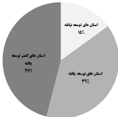
نمودار ۲: تولید ناخالص داخلی در استان‌های ایران (۹۱-۱۳۸۵)

توسعه حد و مرز و سقف مشخصی ندارد و به دلیل وابستگی آن به انسان، پدیده ای کیفی است که هیچ محدودیتی ندارد (بر خلاف رشد اقتصادی که کاملاً کمی است). بنابراین منظور از رشد اقتصادی یک جامعه افزایش تولید آن جامعه است. اما توسعه اقتصادی مفهومی فراتر از تولید بیشتر دارد. بدین ترتیب، می‌توان انتظار داشت که