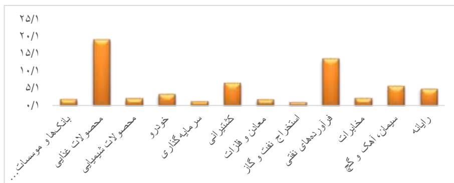
شکل ۳: بررسی میانگین شاخص نقدشوندگی سهام مربوط به دوازده گروه شرکتی از سال ۱۳۹۶-۱۳۸۹ منبع: یافته‌های پژوهش

یکی دیگر از متغیرهای مهم موثر بر شاخص قیمت سهام شرکت‌ها، درصد نقدشوندگی سهام آنها است. به این معنا که همواره سرمایه‌گذاران با توجه به زمان‌بندی نیاز به نقدینگی، وجوه خود را به انواع سرمایه‌گذاری با قدرت نقدشوندگی مختلف تخصیص می‌دهند. این قابلیت به معنای فروش سریع اوراق بهادار و تبدیل به وجه نقد است و بدین معناست که سهامدار در هر زمان توانایی دستیابی به