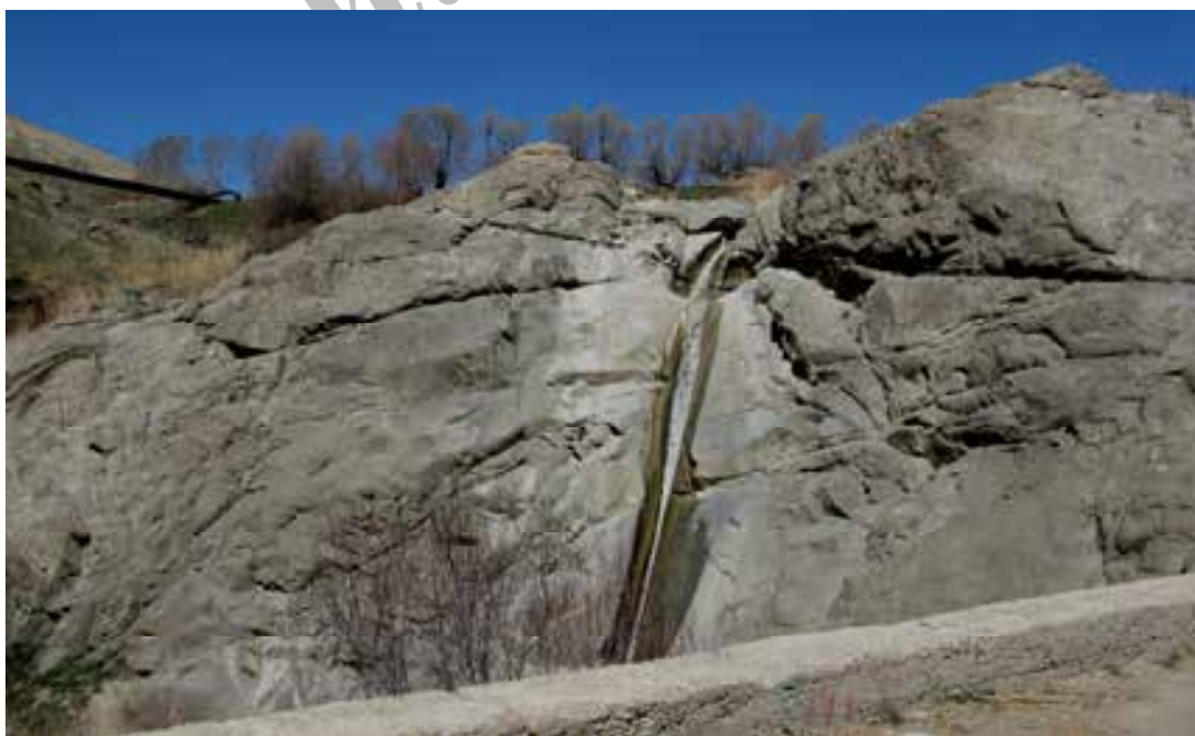
شکل شماره ۳: نمایی از آبشار پسچویک

آبشار پسچویک: در فاصله حدود ۱/۵ کیلومتری شمال شرق روستای افجه و در جبهه شرقی یالی از کوه که به ناحیه دشته و نهایتاً دشت هویج منتهی می‌شود و در موقعیت جغرافیای ۳۵ درجه و ۵۲ دقیقه و ۲۸ ثانیه عرض جغرافیایی و در ۵۱ درجه و ۴۲ دقیقه و ۱۸ ثانیه طول جغرافیایی و در ارتفاع ۲۲۴۶ متر از سطح دریا، آبشار زیبایی وجود دارد که اهالی افجه آن را پسچویک می‌نامند. ارتفاع آبشار پسچویک حدود ۱۵ متر بوده و اطراف آن را درختان بلندی پوشانده است. آب جاری از این آبشار دائمی است و منظره بسیار زیبایی را بوجود آورده است.