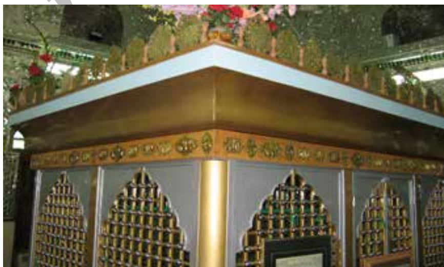
شکل شماره ۶: امامزاده فضلعلی محله ناران لواسان کوچک

در منتهی الیه شرق شهر لواسان کوچک و در ضلع جنوبی محله ناران و حمام تاریخی آن و در جنوب تکیه جدیدالاحداث محله قرار دارد. دارای گنبد پیازی شکل است قدمت آن متعلق به قرون هفت و هشت هجری است این اثر ارزشمند در مهرماه سال ۱۳۸۲ تحت شماره ۱۰۳۷۳ در فهرست آثار ملی به ثبت رسیده است. بنابر متن زیارتنامه نصب شده در داخل بقعه امامزاده نسبت آن بزرگوار فضلعلی ابن موسی الکاظم قید شده و گفته شده از امامزادگان معتبر و دارای شجره قطعی می‌باشد.