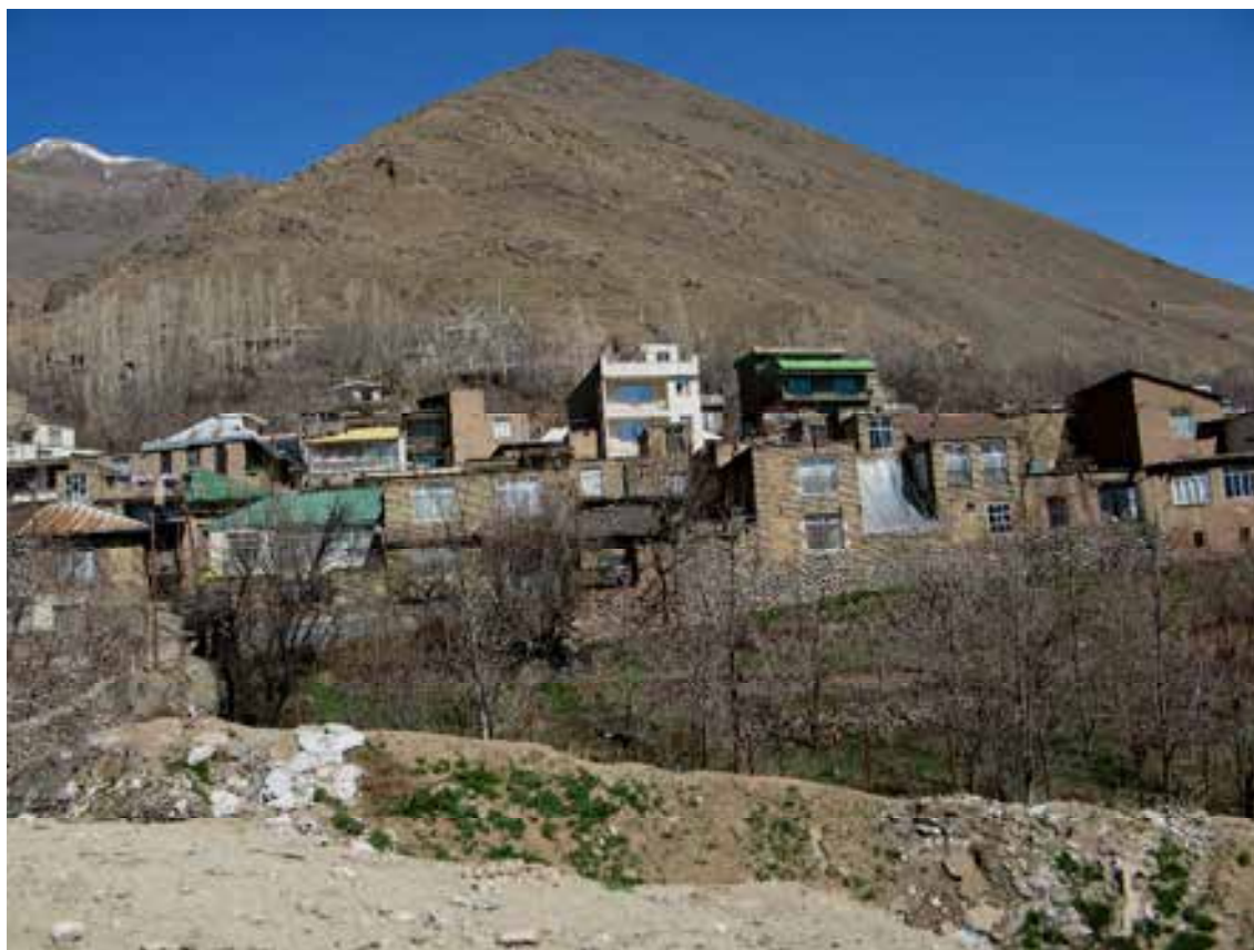
شکل شماره ۱: نمایی از روستای افجه لواسان