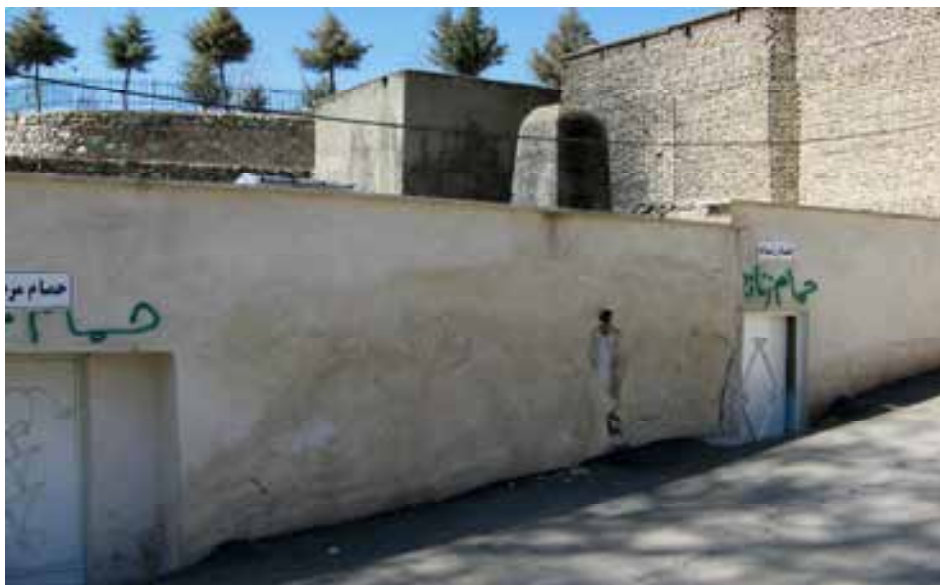
شکل شماره ۵: حمام تاریخی افجه لواسان

در مرکز روستای افجه حمام تاریخی افجه قرار دارد که دارای دو بخش مجزای مردانه و زنانه بوده و ورودی هر دو از سمت شمال می‌باشد. دارای طاق و تویزه و گنبد‌های عرقچین و ستونهای جناغی می‌باشد. قدمت آن به اواخر دوره صفویه یا اوایل حکومت قاجار تعلق داشته است و همچنان تمیز و مرتب مورد استفاده اهالی می‌باشد.