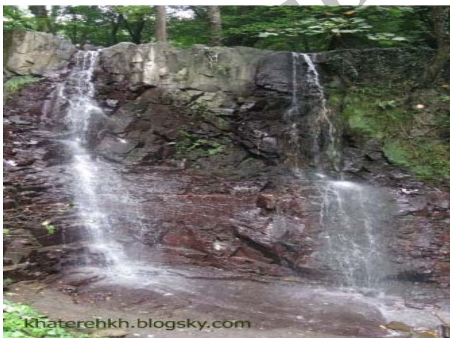
شکل شماره ۴ - عکس آبشار لونک دیلمان که در جنوب شهر سیاهکل قرار دارد.

*پارک جنگلی لونک، یکی از مهمترین اهداف ایجاد پارک جنگلی در درجه اول حفظ و حمایت از گونه های جنگلی در مقابل قطع و بهره برداری غیرمجاز و جلوگیری از تجاوز به عرصه های منابع ملی و کاهش عرصه های تجاوزی و همچنین حفظ آب و خاک و پوشش گیاهی و جلوگیری از فرسایش آن در مراحل بعدی توسعه صنعت گردشگری و غیره می باشد.