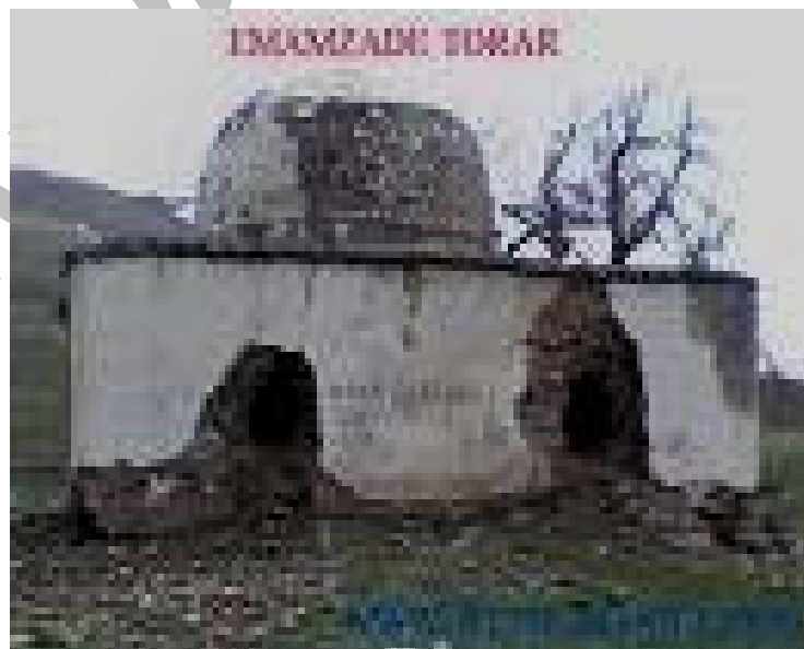
شکل شماره ۳ - عکس امامزاده تورارکه در ارتفاعات روستای جلیسه از توابع دهستان پیرکوه قرار دارد.