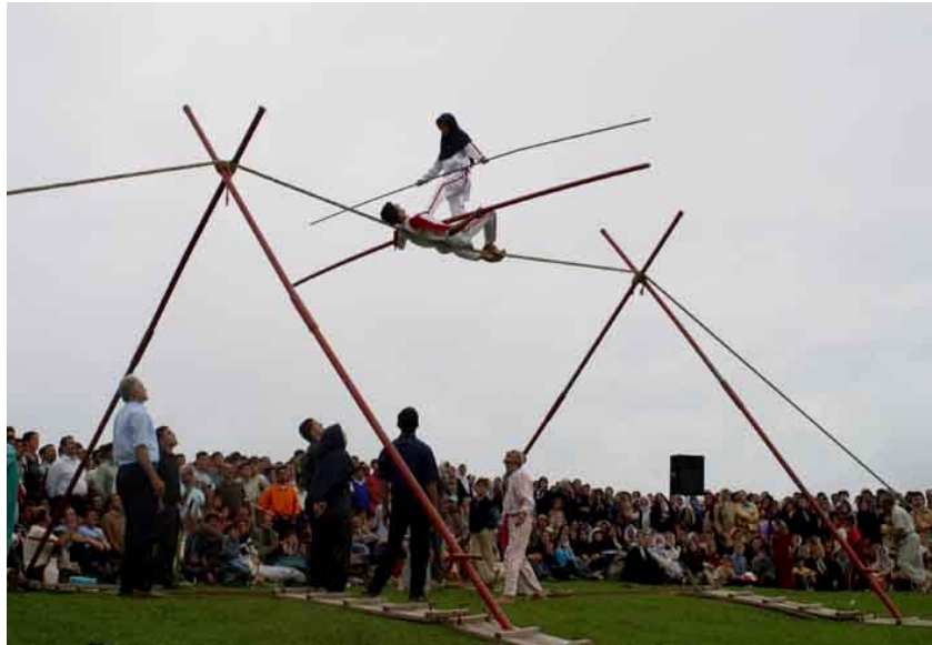
شکل شماره ۸ - عکس لافند بازی که از بازیهای محلی منطقه می باشد.

شامل لافند بازی، کشتی گیله مردی، قیش بازی... (شکل شماره ۸).