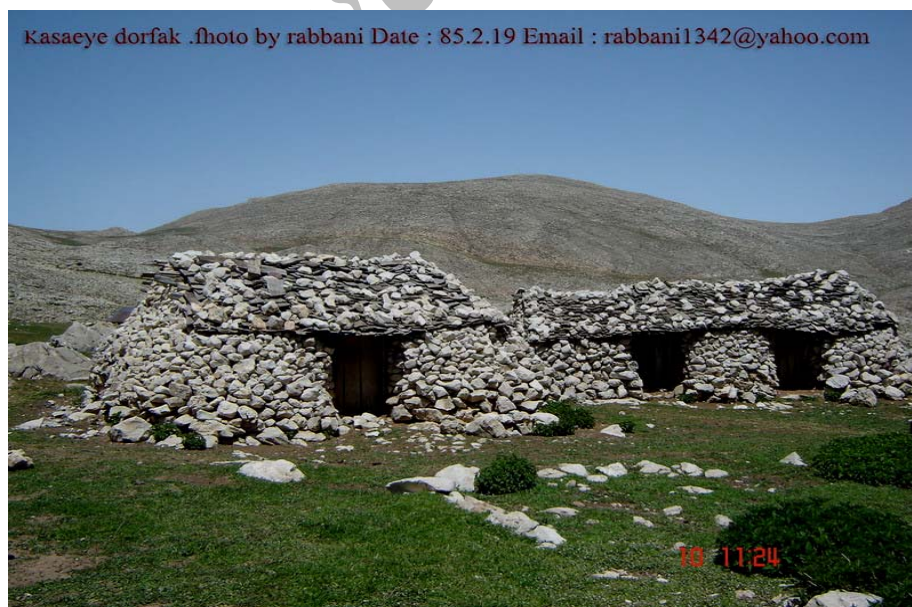
شکل شماره ۶ - عکس خانه های سنگی درفک که در ارتفاعات درفک قرار دارد.

آب وهوا، جنگل ومراتع، چشمه ها (لاریخانی، چشمه گوته بن، چشمه لاوار..)، رود ها، آبشارها (آبشارلونک، آبشار ملومه، آبشار بابا ولی) برکه ها (برکه خونین سل، نفتی سل) کوهستانه و نواحی بیلاقی، غارهای طبیعی (غار درفک، غارملومه، غار تله گلو، غار کوتیل، غار طالشکوه) پدیده طبیعی (بشکافته سنگ) (شکل شماره ۶).