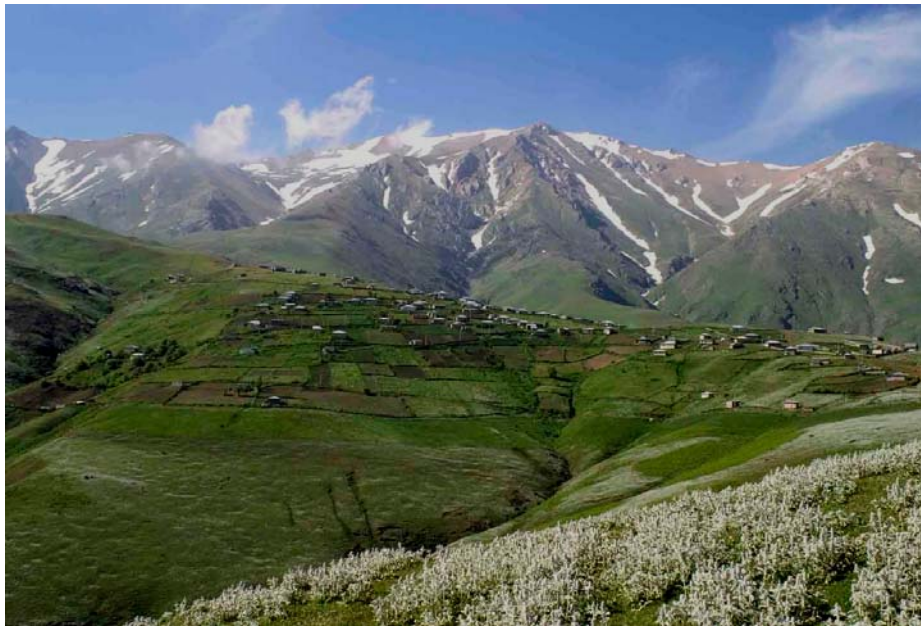
شکل شماره ۵ - عکس منظره بیلاقی که از ارتفاعات دیلمان می باشد.

آب وهوا، جنگل ومراتع، چشمه ها (لاریخانی، چشمه گوته بن، چشمه لاوار..)، رود ها، آبشارها (آبشارلونک، آبشار ملومه، آبشار بابا ولی) برکه ها (برکه خونین سل، نفتی سل) کوهستانه و نواحی بیلاقی، غارهای طبیعی (غار درفک، غارملومه، غار تله گلو، غار کوتیل، غار طالشکوه) پدیده طبیعی (بشکافته سنگ) (شکل شماره ۶).