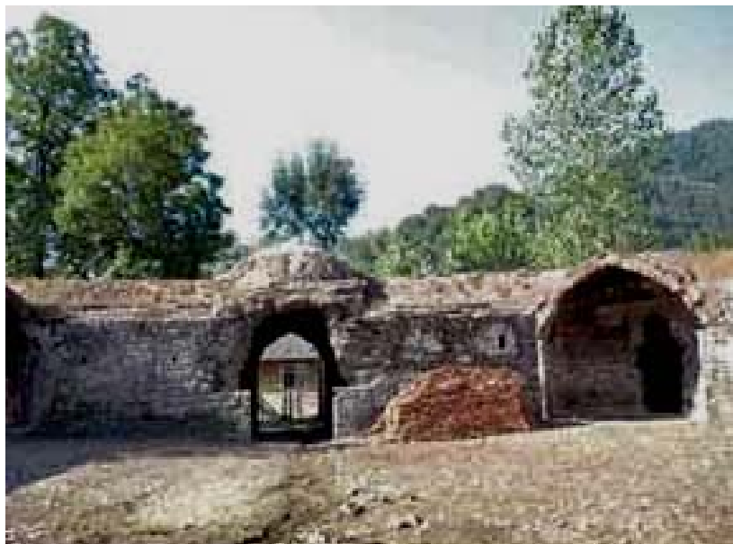
شکل شماره ۲- عکس تی تی کاروانسراکه درده کیلومتری جاده سیاهکل به دیلمان قرار دارد.

* پارک و تفرجگاه جنگلی بالارود، به لحاظ دارا بودن درختان بومی نظیر توسکا، لرگ، ممرز، انجیلی، و بعضا بوته ها و درختچه های شمشاد و از سوی دیگر قرار داشتن در حاشیه رودخانه پرآب و زلال شمرود و برخورداری از مناظر زیبای جنگلهای اطراف و چشم انداز جنگلی - رودخانه از استعداد زیادی برای احداث یک پارک جنگلی کوچک بین راهی با محیطی تفرجی برخوردار می باشد.