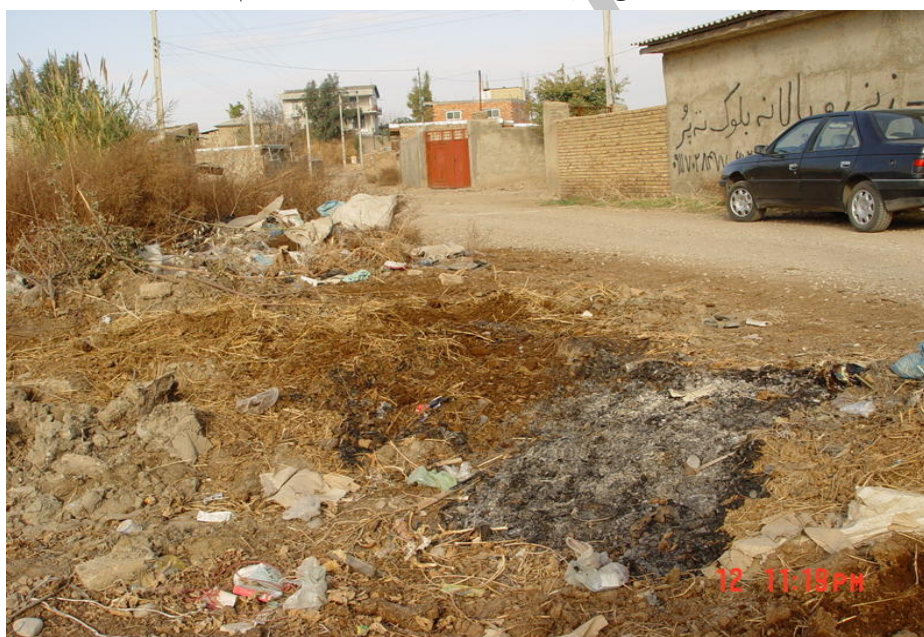
شکل ۳ - دفع نامناسب و سوزاندن زباله در محله غلام تپه