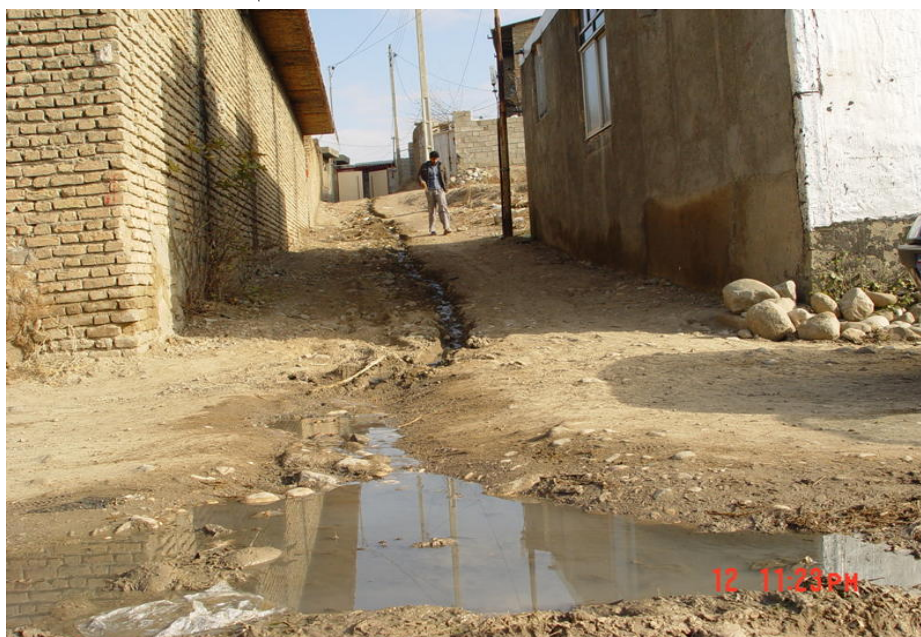
شکل ۲ - هدایت نامناسب فاضلاب در محله غلام تپه