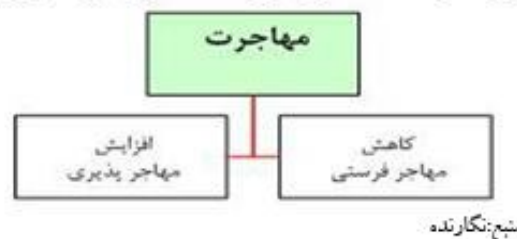
شکل شماره ۳) : شاخصهای مورد مطالعه در مهاجرت در این تحقیق

این مسئله موقعی مشکل ساز می شود که مهاجر فرستی و مهاجر پذیری بدون برنامه و بی رویه باشد و باعث خالی شدن جمعیت یک نقطه و افزایش بی رویه جمعیت نقطه دیگر شود که این امر مشکلات خاص خود را از لحاظ اقتصادی و اجتماعی در بر خواهد داشت. در هر برنامه ای که برای مناطق علی الخصوص نقاط روستایی تدوین و اجرا می شود مسئله مهاجرت باید به طور خاصتر مورد توجه قرار گیرد تا باعث مهاجر فرستی و مهاجر پذیری بی رویه نگردد.