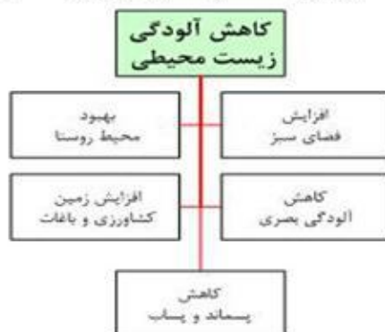
شکل شماره ۴): شاخصهای مورد مطالعه در کاهش آلودگی زیست محیطی در این تحقیق