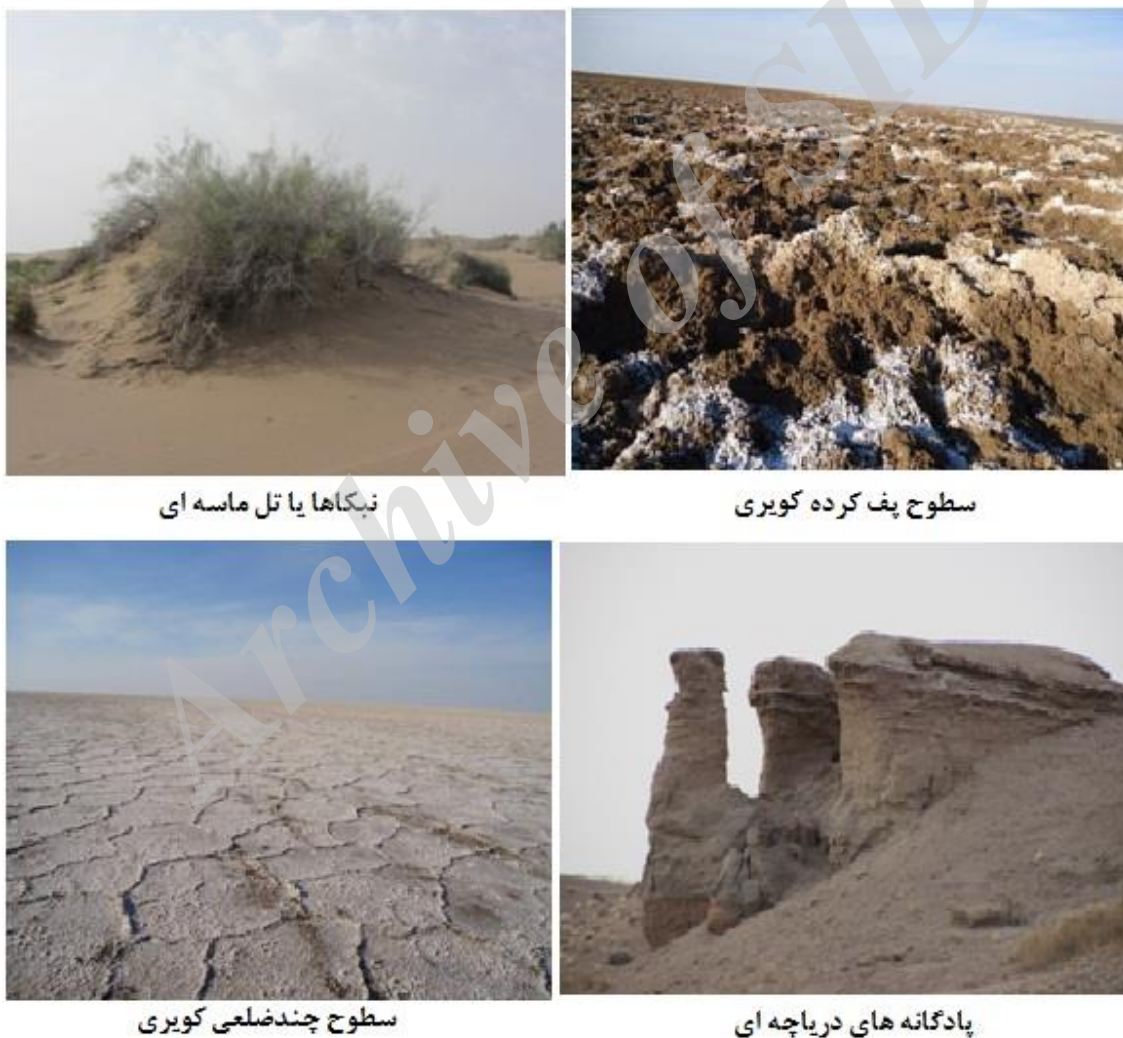
نبکاها یا تل ماسه‌ای

ساختار ژئومورفیک این سایت‌ها به کمک منابع مربوطه مورد بررسی اجمالی قرار گرفته است (جدول-۲). این منطقه که از نظر موقعیت جغرافیایی در مناطق خشک تشکیل می‌شود. به دلیل تنوع زمین‌شناختی، دارای شرایط متنوعی در چگونگی شکل‌گیری عوارض می‌باشند و نیز جاذبه‌های نمونه‌ای در ارتباط با ارزش‌های آموزشی، گردشگری‌های علمی و تحقیقی برای محققین، جاذبه‌های تفریحی (مانند سرخوردن از تپه‌های ماسه‌ای و...)، جاذبه‌های ورزشی (از قبیل دوچرخه‌سواری، اتومبیل‌رانی، شترسواری، پیاده‌روی‌های استقامتی و...) وجود دارد. این ژئومورفوسایت‌ها که در نوشتار حاضر با استفاده از مشاهدات میدانی ارزیابی شدند شامل: پادگانه‌های دریاچه‌ای، برخان‌ها، نبکازارها، پلیگون‌های نمکی یا کویرهای چندضلعی، سطوح پف‌کرده و شخم‌خورده، سنگ‌فرش‌های بیابانی، جزیره سرگردانی در دریاچه نمک، رودخانه شور نمکی، شکوفه‌های نمکی می‌شود. در شکل ۲ تصویر نمونه‌هایی از این ژئومورفوسایت‌ها مشاهده می‌شود.