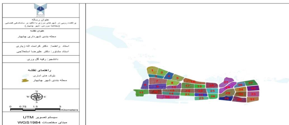
شکل ۲ وضعیت موجود شهر چابهار

با بررسی وضعیت موجود ساماندهی فضایی شهر چابهار، می توان میزان پراکنش جمعیت در سطح محلات، تعداد خانوار، میزان مساحت تخصیص یافته به آن ها را مورد ارزیابی قرار دارد؛ بنابراین وضعیت موجود شهر چابهار در شکل شماره (۲) نشان داده شده است.