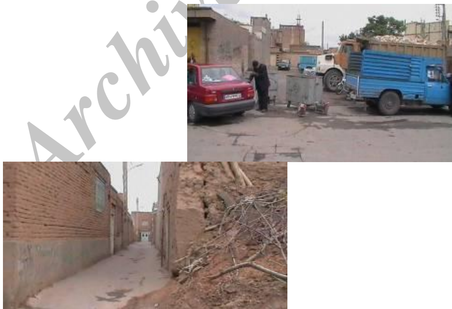
تصویر (۱): بافت کالبدی روستاهای ادغام شده