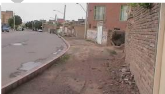
تصویر (۲): وضعیت پیاده‌رو در محله قراملک

در بین ۲۵ گویه پرسشنامه، بیشترین میزان نارضایتی بخصوص در بافت روستایی به وضعیت پیاده‌روها و نوع کفپوش و همچنین کم عرض بودن پیاده‌روها مربوط بوده است؛ به طوری که حتی در برخی از خیابان‌ها مسیر پیاده‌رو از سواره‌رو از هم مشخص نبود.