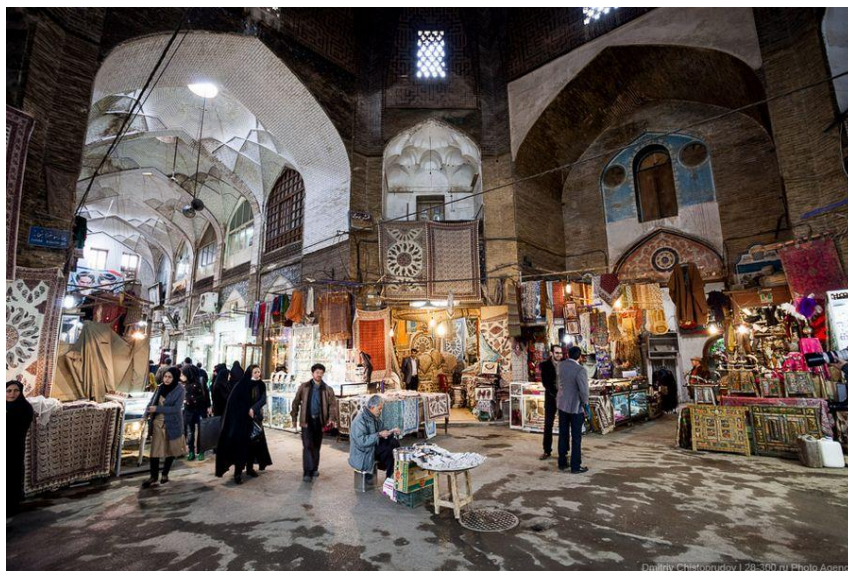
تصویر شماره ۱: تصویری از بازار سنتی اصفهان

ساختار اصلی شهر اصفهان بر محور بازار استوار بوده و قلب تپنده‌ی شهر را ساخته است و زندگی اقتصادی، فرهنگی، سیاسی، اجتماعی و مذهبی را به عهده دارد و با شبکه‌ای از دسترسی‌های بسیار منظم، تمام عناصر شهری را به نحوی در بر گرفته است. در حقیقت، شهر اصفهان بر روی محوری استوار است که بازار، آن را تشکیل می‌دهد و همین مکان جغرافیایی است که به علت تمرکز فعالیت‌های اقتصادی و مبادلات اجتماعی به وجود آمده. این حرکت به بازار هویت خاصی بخشیده است و بی دلیل نیست که اغلب نویسندگان، ساختار شهری را مبتنی بر اصول مکانیزم بازار می‌دانند (درکوش، ۱۳۶۴: ۴۰).