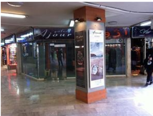
تصویر شماره ۲: تصویری از مجتمع خرید پارک اصفهان

مجتمع پارک اصفهان در سال ۱۳۵۷ با زیربنای مفید حدود ۱۵۰۰۰ مترمربع احداث گردیده است. فضای محیطی این بازار به گونه‌ای طراحی شده که مراجعان و خریداران علاوه بر خرید، از فضای سبز آن نیز استفاده نموده و به عنوان یکی از گردشگاه‌های اصفهان با کاربری (پارک-بازار) خود را شناسانده است. این مجموعه شامل ۴۰۰ واحد تجاری است در رشته‌های پوشاک، ساعت، کیف و کفش، لوازم صوتی و تصویری، لوازم موسیقی، اسباب بازی و لوازم کودکان، کامپیوتر و نرم‌افزار و لوازم جانبی، کادوئی، رستوران و فست فود، لوازم التحریر، آرایشی و بهداشتی، ورزشی و... همچنین واحدهای خدماتی شامل پزشکان مجرب با تخصص‌های مختلف، دفاتر مهندسی و تجاری، مشاوران املاک، برگزارکنندگان مراسم و جشن‌ها، مؤسسات عکاسی و فیلمبرداری از مجالس، آرایشگاه و نمایندگی‌ها مشغول به فعالیت هستند.