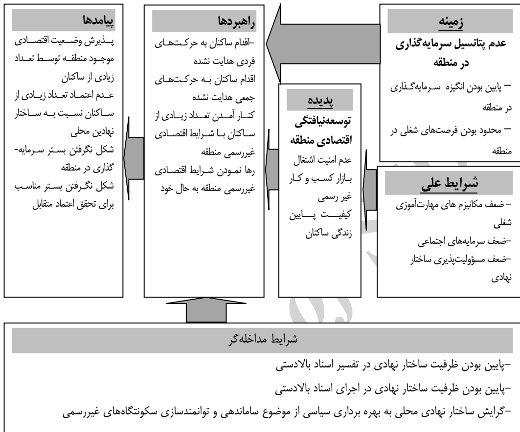
شکل ۲: مدل پارادایمی