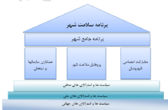
شکل شماره‌ی ۱: نقش مشارکت اجتماعی و همکاری سازمان‌های شهری در ایجاد سلامت شهر

نخستین تعریفی که در ارتباط با شهر سالم بیان شده است تعریف پروفیسور دوهل بوده است، وی محیط‌های شهری را به‌عنوان یک محیط ارگانیک زنده که سالم است و سلامتی را نیز برای شهروندان فراهم و آن‌ها را توانمند می‌کند که در مسائل سلامت خود مشارکت فعال داشته باشند تعریف می‌کند (احمدی، ۱۳۸۵: ۳). مشارکت اجتماعی و همکاری چندبخشی و بین بخشی به‌عنوان اصول استراتژی سلامت برای WHO به شمار می‌آید که پروژه‌ی شهر سالم نیز اصول را به‌صورت محلی آغاز کرد چراکه شهرها صرفاً مکانی نیستند که بتوان آن را با ابزارهای فنی و تفکرات کالبد گرا برنامه‌ریزی و مدیریت کرد، بلکه در کنار آن به مشارکت اجتماعی و بهره‌گیری از پتانسیل‌های قابل توجه عنصر شهرنشینی (انسان) نیز نیازمند است (علی‌اکبری و برزگر، ۱۳۸۹: ۲). اساساً پروژه‌ی شهر سالم بر پایه‌ی مشارکت مردم در حل مسائل و مشکلات و هماهنگی بین‌بخشی تبیین می‌گردد و مشارکت مردم در این پروژه اولویت خاص دارد (ارجمندینا، ۱۳۷۹: ۲۷). سازمان جهانی بهداشت نقش مشارکت اجتماعی و همکاری سازمان‌های شهری در ایجاد سلامت شهر را به‌صورت شکل شماره‌ی ۱ نشان داده است.