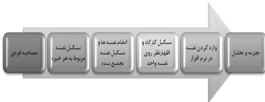
شکل ۱- مراحل روش تحلیل و توسعه گزینه‌های استراتژیک (فخیمی آذر، مالک و

سازمانی را در قالب این مدل مورد بررسی و تجزیه و تحلیل قرار داد. با استفاده از این مدل عوامل دخیل در یک مساله در قالب سه دسته از عوامل (رفتاری، ساختاری و زمینه‌ای) مورد بررسی قرار می‌گیرد (میرزایی، طالقانی و سعدآبادی، ۱۳۹۲). لذا در این پژوهش نیز با بهره‌گیری از این مدل به تجزیه و تحلیل راهکارها پرداخته است.